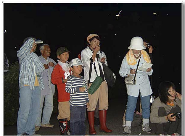
ブトの攻撃，虫の激突に耐えながら …