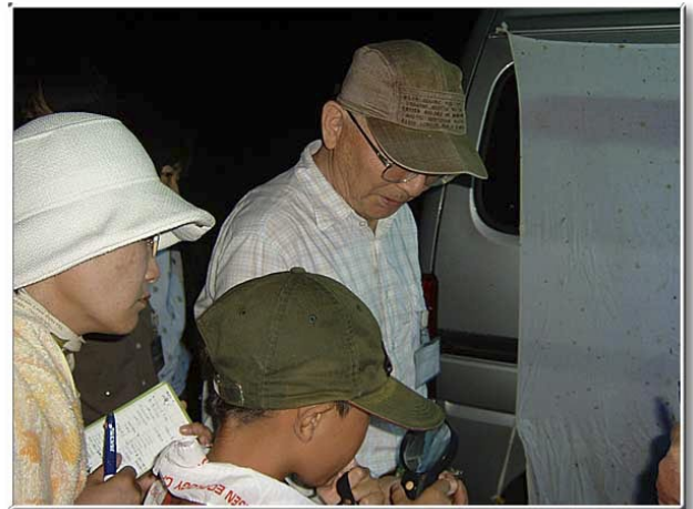
虫眼鏡で拡大して観るとなかなかきれい…不思議.