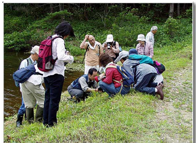
モウセンゴケは小さくて，みんな地面にへばりつくようにして，観る。