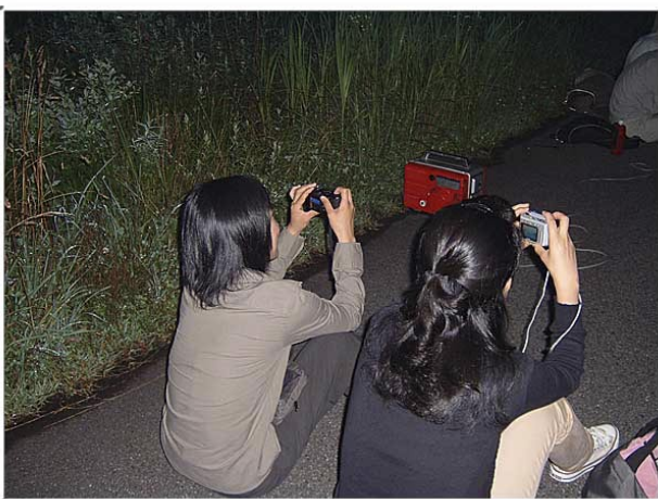
観察会風景を撮影中.