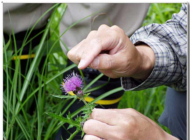
虫がとまるとその重さに反応して、受粉のため花粉を出す。