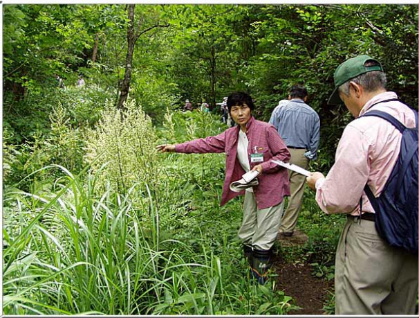
バイケイソウ，少しにおう。