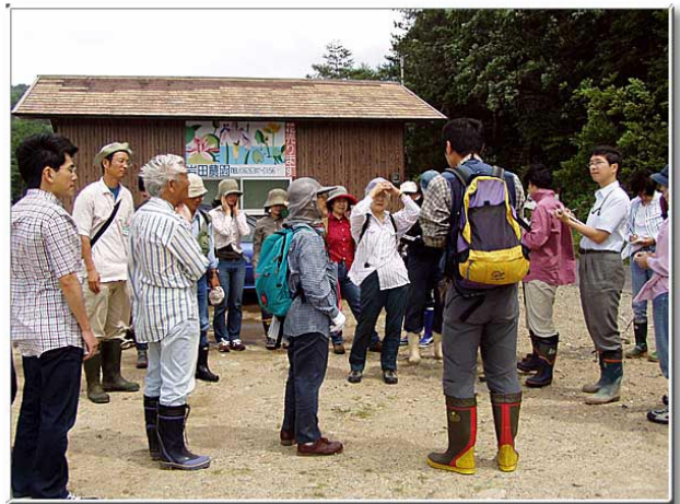
これから出発です。