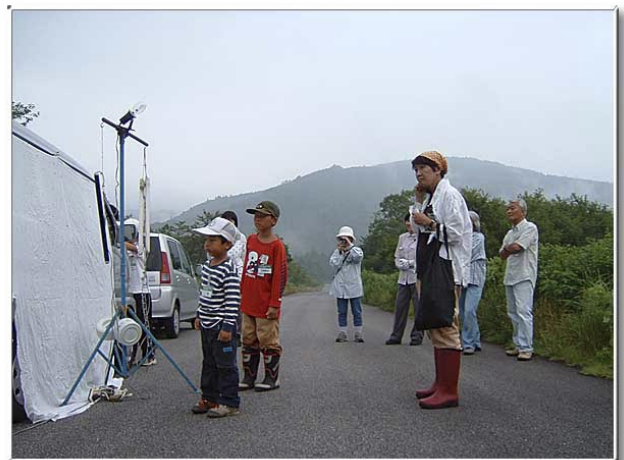
18:30はまだ明るくて、昆虫来るの？先生のお話を真剣！に聞く。