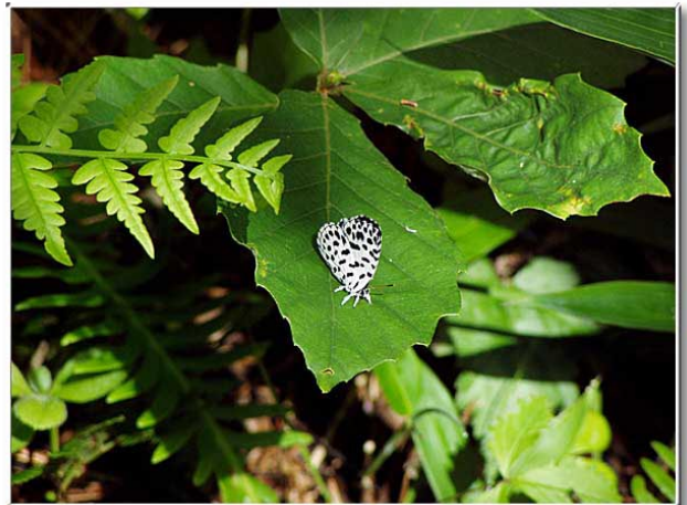
ゴイシジミは幼虫がササに付いたアブラムシを食べる。