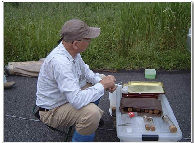
昆虫を採取して酢酸エチルを染み込ませた瓶に入れる。

スジシャチホコ、ナカキシャチホコ♀、クワゴモドキシシャチホコ♀、*セダカシャチホコ、*シロヒトリ、オオケンモン♀、ウスベリケンモン♂、ゴマケンモン♂、ネグロケンモン♂、キシタケンモン♂、*キタバコガ」