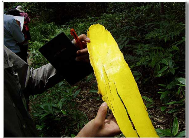
キハダの倒木あり，薬用，飲み過ぎに効く。