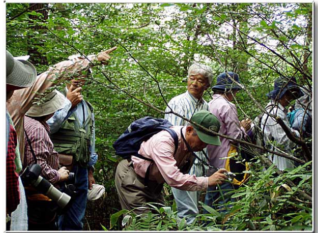
ノシメトンボを撮る人，シュレーゲルアオガエルを撮る人。