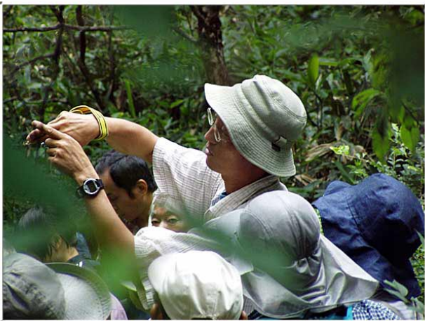
オニヤンマの抜け殻，羽化の環境も様々だが，条件にあった場所の減少で羽化がむずかしくなっている。