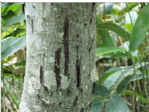
古いけど，ツキノワグマの爪痕。