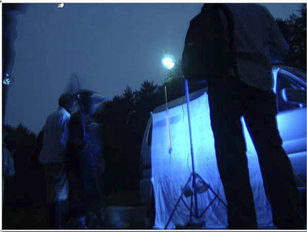
だんだん暗くなり，期待が高まる.